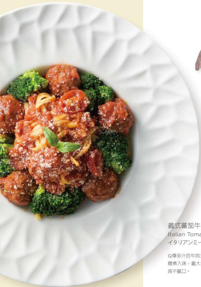
義式蕃茄牛肉丸義大利麵 $320 Italian Tomato Beef Ball Pasta イタリアンミートボールのトマトパスタ

Q彈多汁的牛肉丸搭配酸甜蕃茄醬汁，經慢火燉煮入味；義大利麵條搭配經典義式茄汁，清爽不膩口。