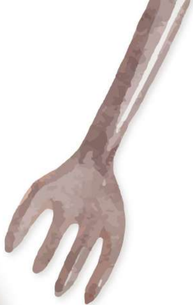
培根蛋黃奶油義大利麵 $320 Carbonara カルボナーラスパゲッティ

Q彈多汁的牛肉丸搭配酸甜蕃茄醬汁，經慢火燉煮入味；義大利麵條搭配經典義式茄汁，清爽不膩口。